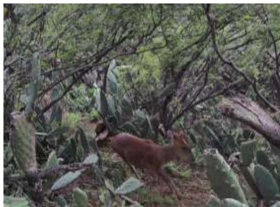
野生动物与农田共存